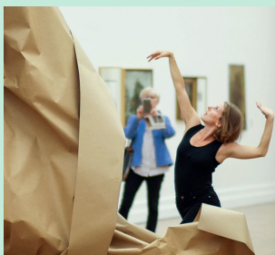
Collectif des Routes