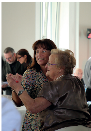
Ville de Bischheim

À partir de 12 ans Gratuit - Surinscription