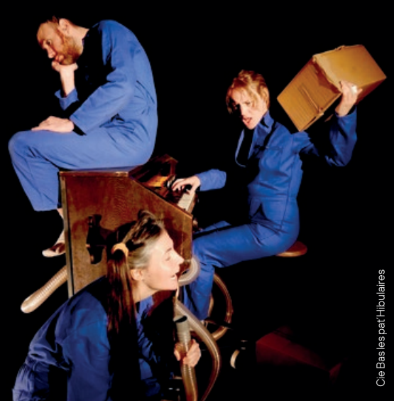
Cie Basles pat'Hibulaires